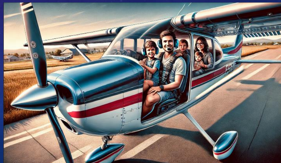
Ilustrační foto – vytvořeno AI