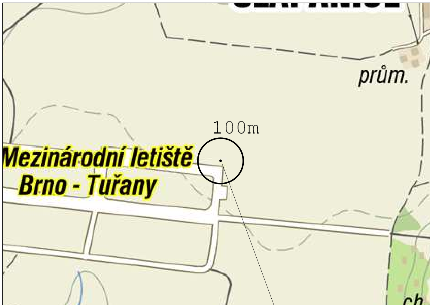
SYSTÉMOVÁ ANTÉNA - STŘED OCHRAN.PÁSMA