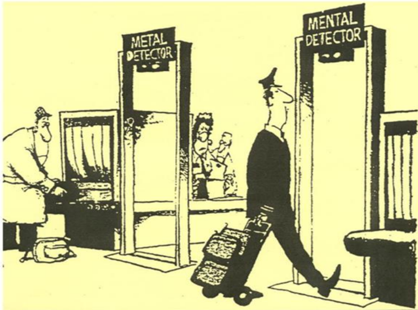
By Jim Borgman, The Cincinnati Enquirer